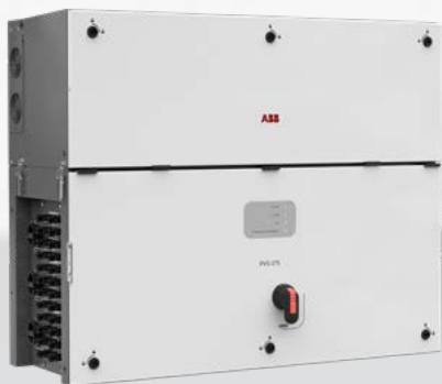
— PVS-175-TL Inverter di stringa da esterno