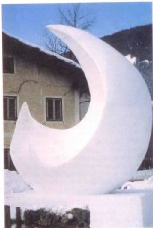
Due opere realizzate nelle passate edizioni.